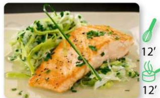
Saumon roti, étuvée de poireaux

Vous choisissez en fonction de vos goûts, de votre budget et du temps dont vous disposez. Vous composez un repas ou le planning de la semaine